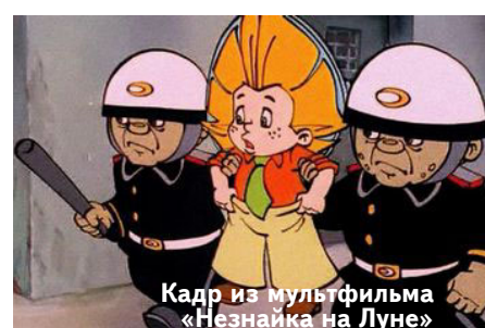
Кадр из мультфильма «Незнайка на Луне»

Очень знаменита сейчас книга Николая Носова «Незнайка на Луне» из цикла произведений про приключения Незнайки. В произведении главный герой отправляется из Солнечного города, который очень смахивает на светлое будущее или путь к нему, на Луну, уж очень напоминающую реальность за окном. Я не буду цитировать отрывки, если вы вдруг незнакомы или забыли за давностью лет, то поищите в сети, это, право, увлекательное чтение, особенно, если учесть, что впервые роман публиковался по частям в 1964—1966 годах. То, что тогда казалось фантастикой и какой-то совсем нереальной пропагандой,