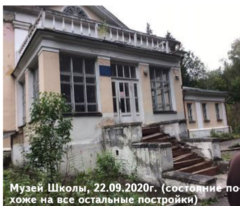
Музей Школы, 22.09.2020г. (состояние похоже на все остальные постройки)

От КС ДЗД и редакции. По имеющимся сведениям, школу, которая была открыта в 2021 г. по инициативе Н.К. Крупской, поддержанной В.И. Лениным, именно в помощь сельским детикам младшего возраста, а позже стала образцовым образовательным учреждением для детей всех школьных возрастов, теперь планируют лишить младшей ступени образования, и даже после ее восстановления (все-таки надеемся, что это произойдет, хотя на сегодняшний день, через 2 года после «приостановления» никаких работ по ее восстановлению не ведется!) дети младшего возраста из 8 близрасположенных посел-